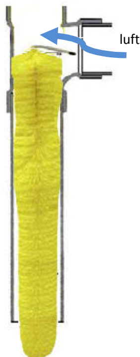
Rätt Installerat Filter